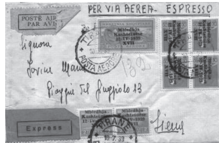
Lotto n° 792