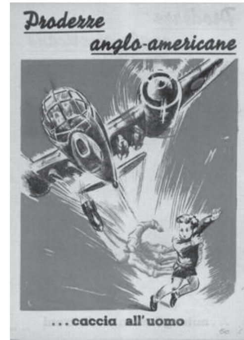
Lotto n° 1044