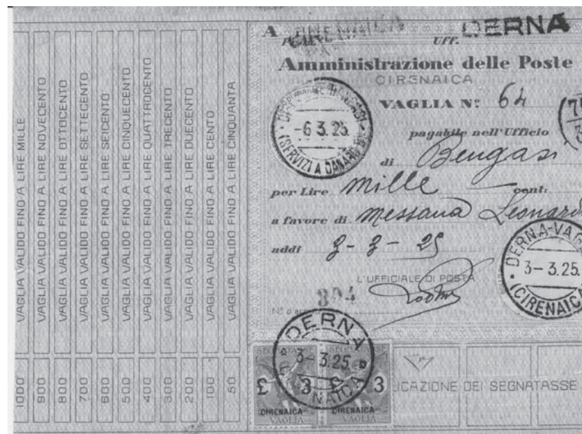
Lotto n. 1131