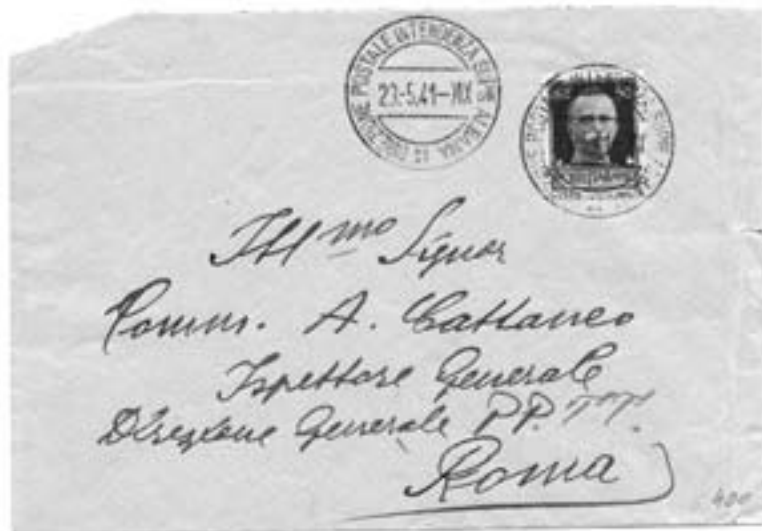
Lotto n. 3362