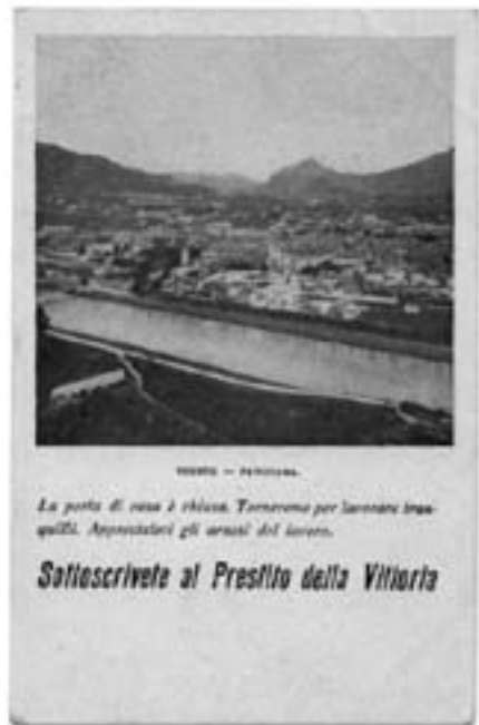
Lotto n. 3621