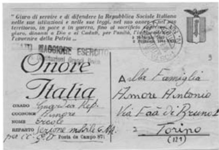
Lotto n. 3642