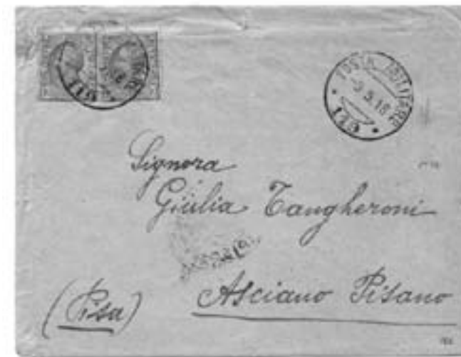
Lotto n. 3326