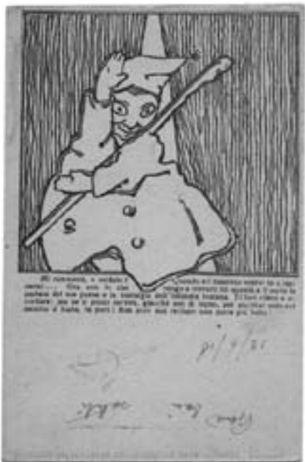
Lotto n. 3619