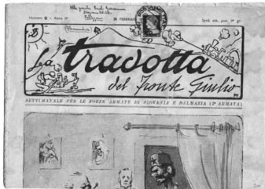
Lotto n. 3413