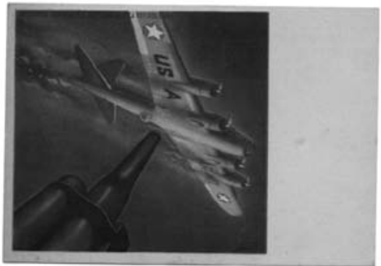
Lotto n. 3647