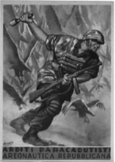
Lotto n. 3643