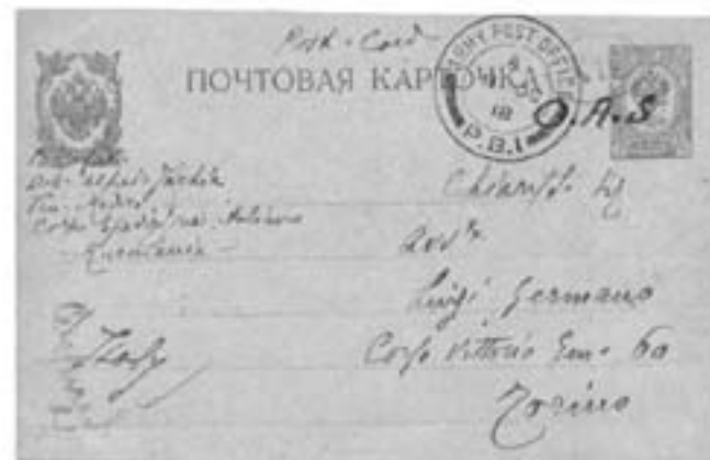
Lotto n. 3232