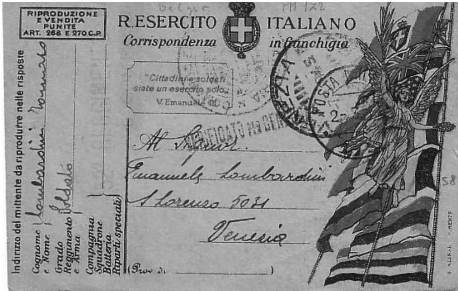
Lotto n. 460