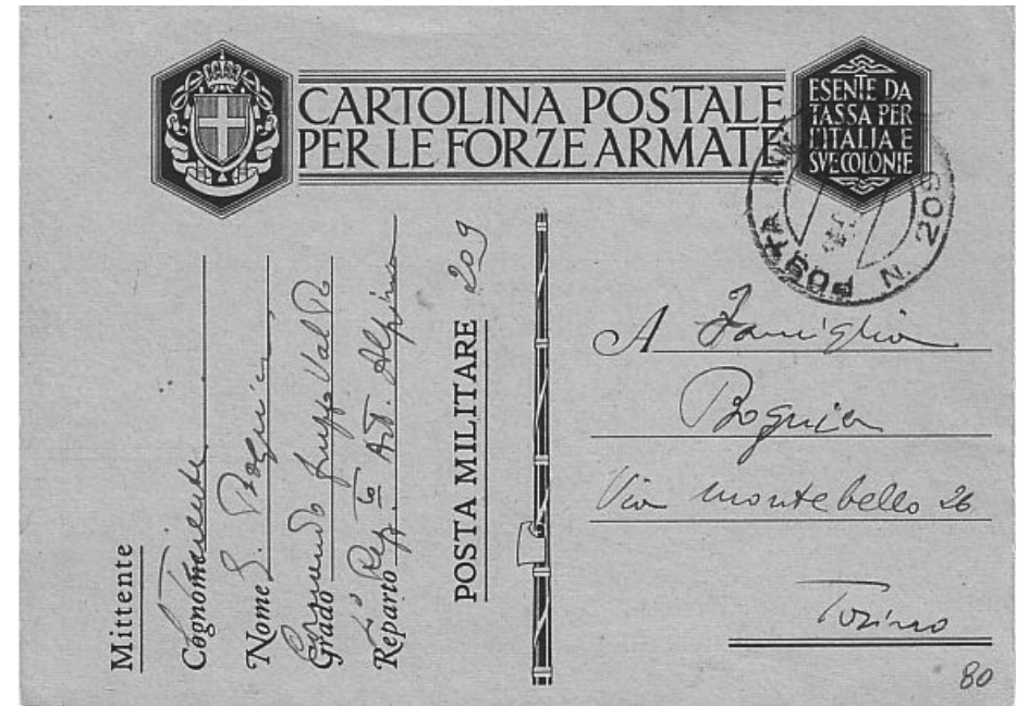
Lotto n. 656