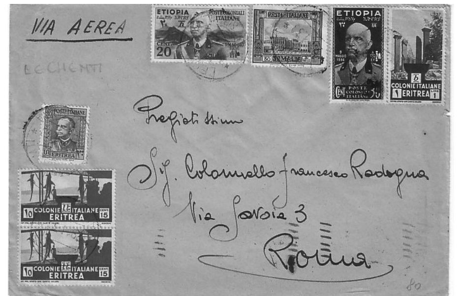
Lotto n. 741